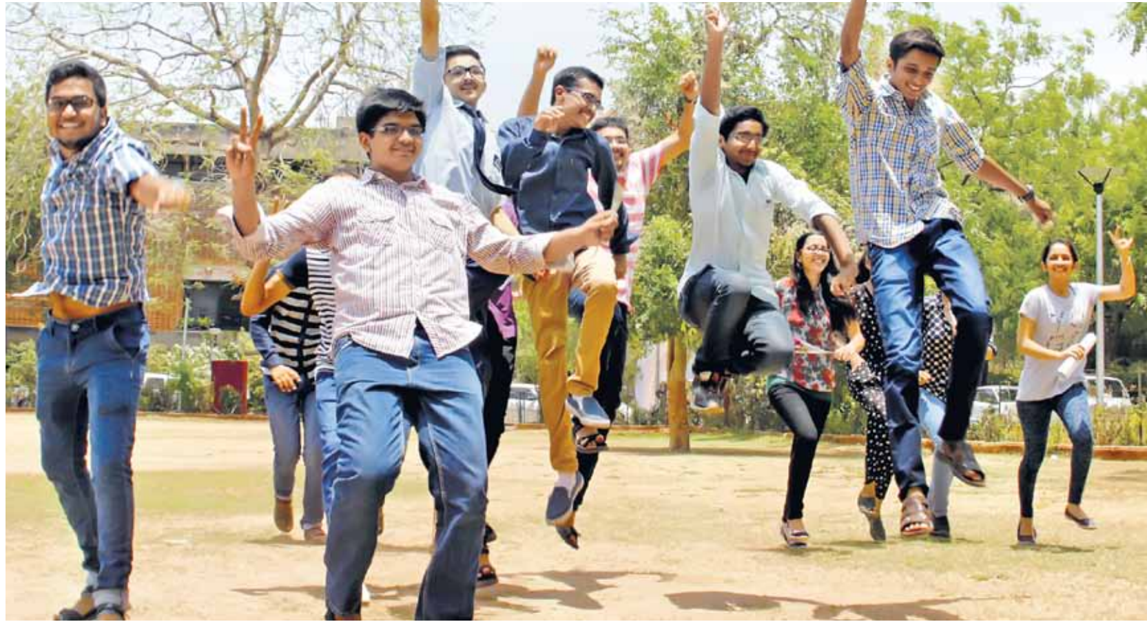
આખું વર્ષ મહેનત કરીને ધોરણ 12 વિજ્ઞાન પ્રવાહમાં ઝળહળતું પરિણામ મેળવનાર અમદાવાદના તેજસ્વી વિદ્યાર્થીઓ પાલડી ખાતેના સંસ્કાર કેન્દ્ર ખાતે એકઠા થયા હતા જ્યાં પ્રાંગણમાં ખુશીથી ઝૂમી ઊઠ્યા હતા.

વિદ્યાર્થીઓએ આ વર્ષે પણ એન્જિનિયરિંગમાં પ્રવેશ મેળવવા માટે ડોનેશન આપવાની અથવા તો પ્રવેશ મેળવવા ઉતાવળ કરવાની જરૂરિયાત રહેતી નથી. આ વર્ષે પણ ડિગ્રી એન્જિનિયરિંગમાં ઉપલબ્ધ 71 હજાર બેઠકો સામે 64 હજાર વિદ્યાર્થીઓ પાસ થયા છે જેના કારણે રાજ્યમાં 25 હજારથી વધુ બેઠકો ખાલી રહે તેવી સંભાવના છે. જ્યારે બી ગ્રુપમાં ગયા વર્ષ કરતાં આ વર્ષે પરિણામ 11 ટકા ઘટ્યું છે. બંને ગ્રુપમાં 2014માં એ1 ગ્રેડ મેળવનારા વિદ્યાર્થીઓની સંખ્યા 306 હતી જે 2015માં 427 થઈ છે પરિણામે મેરિટ ઊંચું જઈ શકે છે.